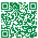
Hino: Há pressa no ar!